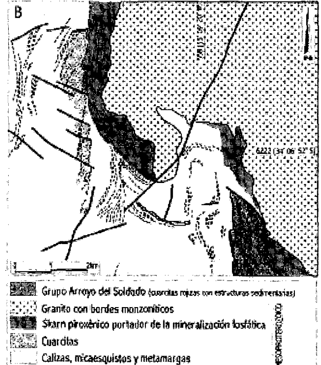
Figura 3. A: Carta geológica de la anomalía Barriga Negra. Las líneas entrecortadas representan la traza de la foliación del Complejo Metamórfico Grenvilliano. B: Idém de la anomalía Arroyo del Soldado.

mostrando abundante anfíbol como accesorio, disminución del tenor de cuarzo y aumento relativo del porcentaje de plagioclasa, lo que permite clasificarlo como un monzogranito.